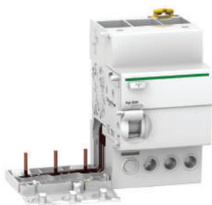
Vigi Module 3P