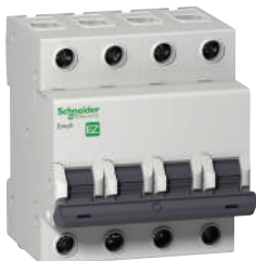
EZ9 MCB 4P