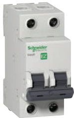
EZ9 MCB 2P