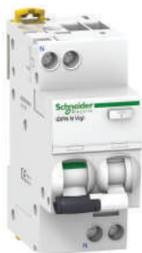
iDPN N 1P+N