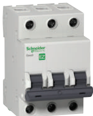
EZ9 MCB 3P