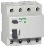
RCCB 4P EZ9